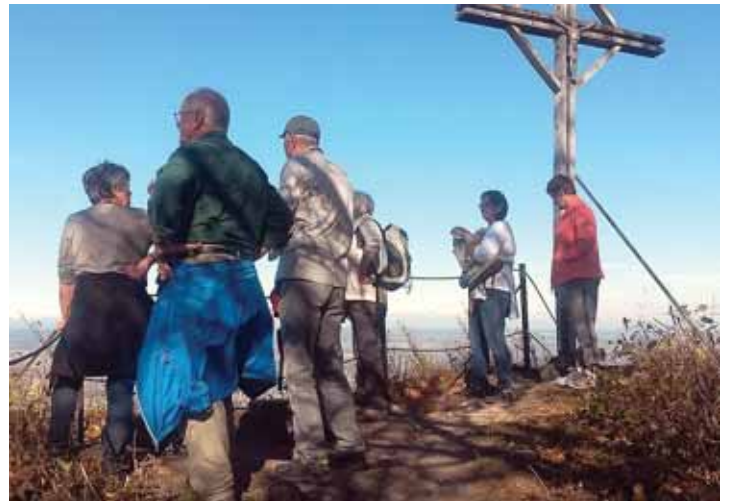
Die Wanderschar erreichte den Gipfel des Hohenstoffeln und genoss den unvergleichlichen Ausblick in die Hegaulandschaft.

Nach der Umrundung des Berges wurde der Abstieg über den Zugangsweg vorgenommen und bei der obligaten Einker im Weiterdinger »Landerstüble« die Eindrücke bei einem guten Vesper und einem Getränk nochmals eingehend ausgetauscht und Revue passieren gelassen.