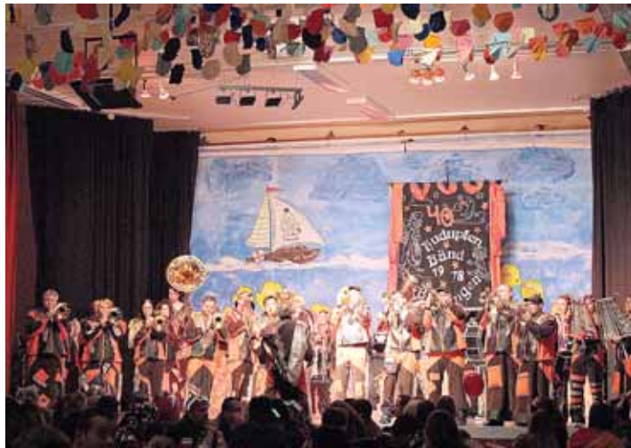
Traditionell wurde der Abend rhythmisch und musikalisch durch die ortsansässige Hudupfen-Band eröffnet.