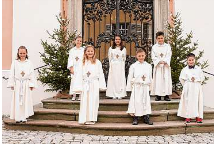
Ein strahlender Tag: 7 von 30 Kommunionkindern der Seelsorgeeinheit empfangen am 11. April 2021 die erste heilige Kommunion in der Barockkirche St. Peter und Paul in Hilzingen.

Das DRK bittet nur zur Blutspende zu kommen, wenn man sich gesund und fit fühlt. Spendewillige mit Erkältungssymptomen (Husten, Schnupfen, Heiserkeit, erhöhte Körpertemperatur), sowie Menschen die Kontakt zu einem Coronavirus-Verdachtsfall hatten oder sich in den letzten zwei Wochen im Ausland aufgehalten haben, werden nicht zur Blutspende zugelassen. Man muss bis zur nächsten Blutspende 14 Tage pausieren. Informationen rund um die Blutspende bietet der DRK-Blutspendedienst erhält man auch über die kostenfreie Service-Hotline 0800-11 949 11.