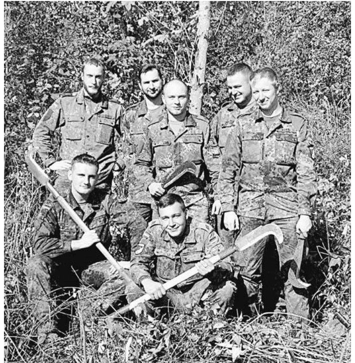
Die Soldaten der Patenkompanie führten eine dringend notwendige Pflegemaßnahme im Gemeindewald Hilzingen durch.

Am kommenden Donnerstag, 8. November, findet in Hilzingen um 19 Uhr die Kommandoübergabe der Patenkompanie statt. Der Musikverein Hilzingen wird hierzu aufspielen. Die Bevölkerung ist herzlichst dazu eingeladen.