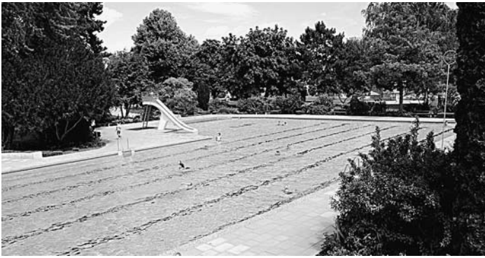
Morgen, Samstag, 4. Mai, wird die Badesaison 2013 eröffnet.