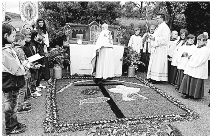
Am Mittwochnachmittag nach dem starken Regen vom Vormittag wurde entschieden, die 3 Stationen für eine Prozession vorzubereiten, und so legten ab 5 Uhr in der Früh fleißige Hände, wie hier an der letzten Station die Frauengruppe der Seelsorgeeinheit, wunderschöne Blumenteppeiche.