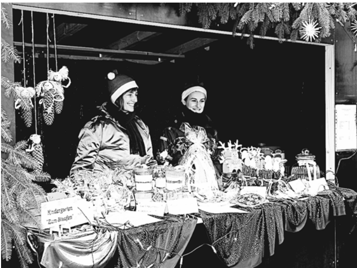
Der Kindergarten »Zum Staufen«, die Christliche Schule und das Hilzinger Rote Kreuz konnten sich erstmals über die neuen Marktstände freuen, die sie bereits aufgebaut an ihrem vorgesehenen Platz am Hilzinger Weihnachtsmarkt vorfanden.