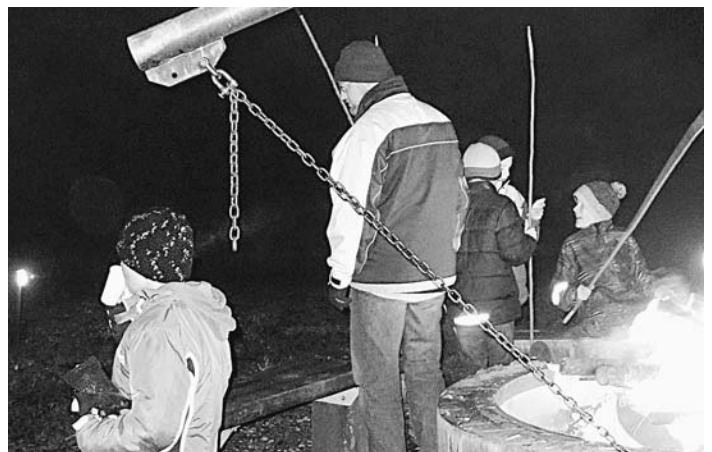
Bei der Fackelwanderung des Haus- und Gartenvereins Ende Dezember konnten die Kinder eine Grillwurst am Lagerfeuer genießen und sich so für den Rückmarsch vom Grillplatz stärken.

An der Christlichen Schule sind folgende Abschlüsse möglich: Hauptschulabschluss, Realschulabschluss, Mittlere Reife sowie Abitur (ab SJ 12/13 für alle Fünftklässler). Geboten wird ein spannender Abend zum Thema »Schule der Zukunft – so kann Schule gelingen«, Besichtigung der Lernlandschaften und der Fachräume, Einsicht in die Pläne für den Schulneubau. Eingeladen sind Eltern von Grundschulern, Eltern von zukünftigen Fünftklässlern, Eltern von Quereinsteigern bis Klasse neun, Eltern, die das Schulkonzept vertiefen möchten, Schüler und Schülerinnen, die sich über die zukünftige Schule eine Meinung bilden wollen, sowie alle Interessierten.