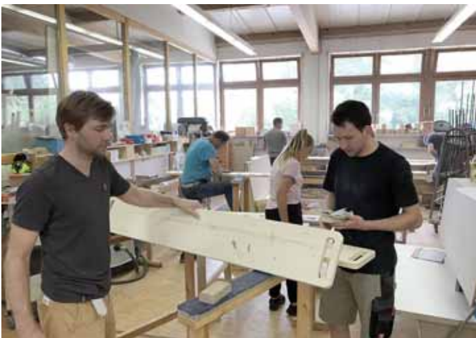
Zur Erinnerung an den 64. Kreisfeuerwehrtag haben sich die Feuerwehrkameraden aus Hilzingen für alle 51 Wettkampfgruppen etwas Besonderes einfallen lassen. Was genau wird noch nicht verraten.