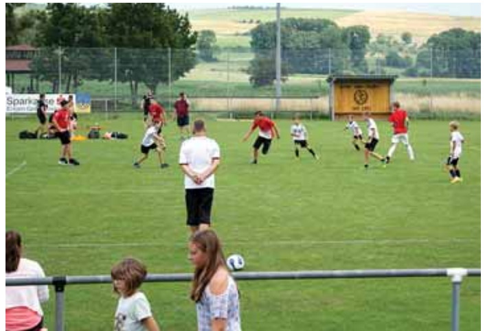
Der Samstagvormittag stand beim Sportwochenende in Weiterdingen ganz im Zeichen der Jüngsten.