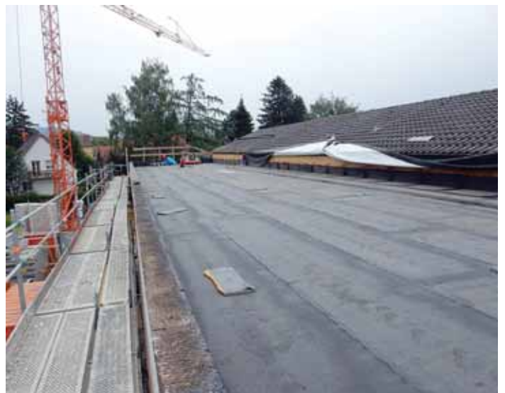
Aktuell wird das Flachdach der Erweiterung abgedichtet.