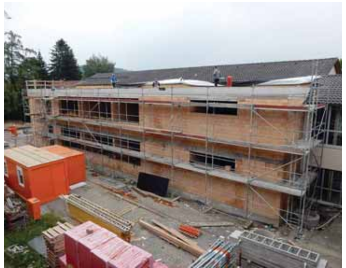
Die Rohbauarbeiten im Bereich des Südbaus (Richtung Norden/Innenhof) sind abgeschlossen.