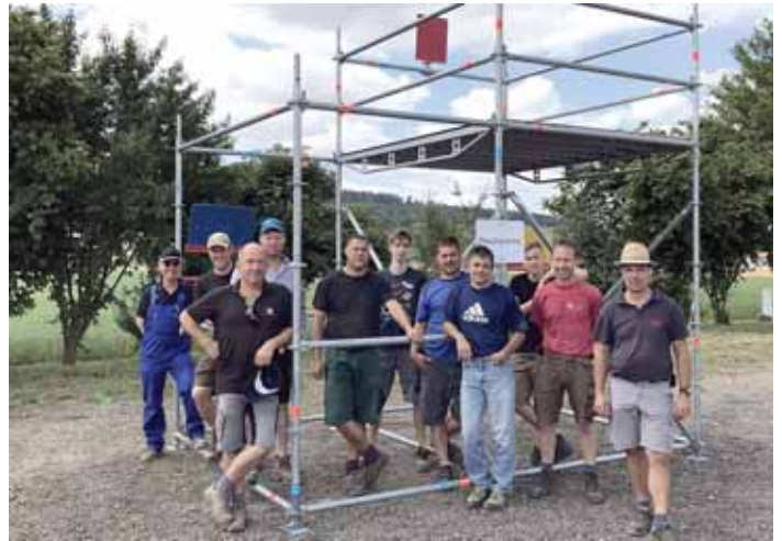
Rupert Metzler, Bürgermeister

Insgesamt vier Wettkampfbahnen wurden für den Kreisfeuerwehrtag, der in diesem Jahr vom 6. bis 8. Juli in Hilzingen stattfindet, von den Feuerwehrkameraden aus Duchtlingen und Hilzingen aufgebaut. Hier stehen die Kameraden vor einem Wettkampferüst für den Löscheinsatz. Mehr auf den Seiten 4 und 5.