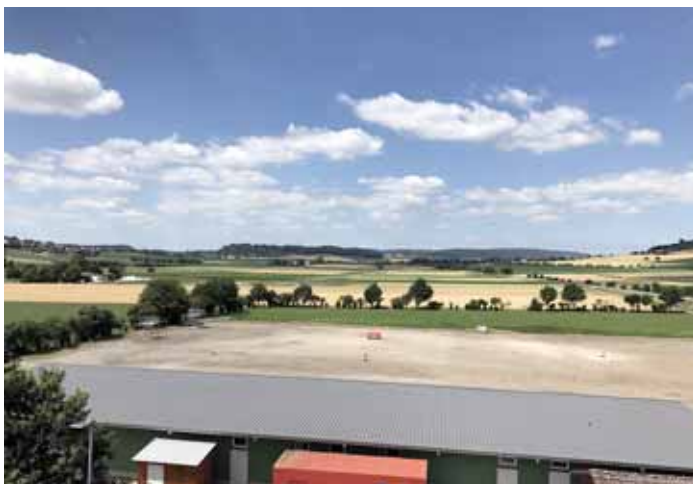
Der Festplatz in Hilzingen ist für das große Fest der Feuerwehren im Landkreis Konstanz bereit. Am kommenden Wochenende wird darauf das große Festzelt aufgebaut.