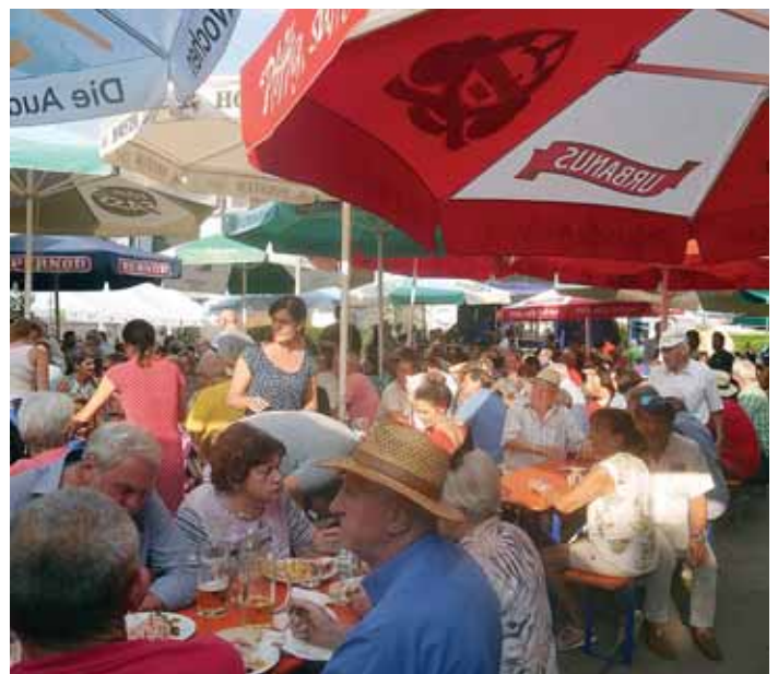
Einen großen Besucherandrang erlebte das Schlatter Scheunenfest. An allen drei Tagen gab es, wie hier am Sonntagabend, zeitweise keine Sitzgelegenheiten mehr.