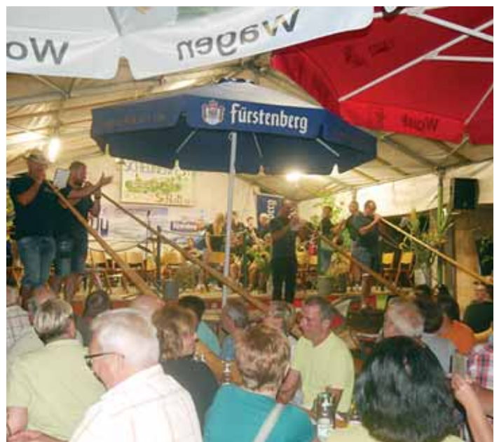
Ihr Können auf dem Alphorn bewiesen die »Beurener Alphornbuben« beim großen Bierabend, bei dem die Musikvereine aus Mühlhausen und Beuren a.d.A. für eine tolle Stimmung sorgten.