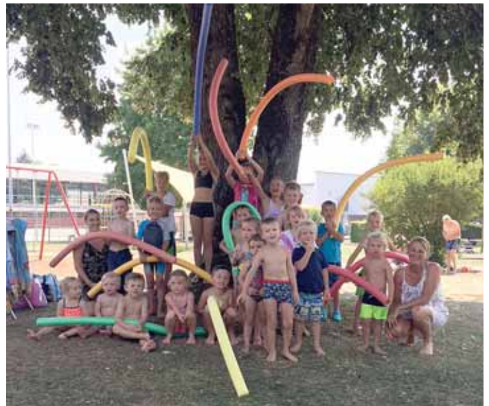
Strahlende und stolze Kinder nahmen die verdienten Abzeichen bei der Schlatter Schwimmwoche gerne entgegen.

Bei den fünf tollen Vormittagen wurden die Kinder auf folgende Abzeichenprüfungen vorbereitet: Seepferd, Pirat, Bronze und Silber. Eric Steidle vom DLRG war am Samstag bereit noch weitere Prüfungen abzunehmen.