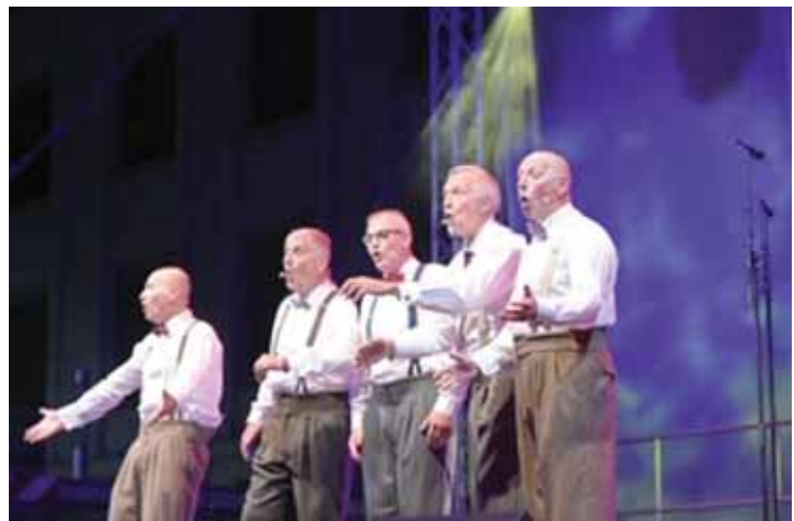
Am Freitag, 28. Juni, veranstaltet der Haus- und Gartenverein in der Remise einen Sommerliederabend mit den »Dramatischen Vier«.

Konzertbeginn ist um 20 Uhr, der Haus- und Gartenverein Hilzingen bewirtet ab 19 Uhr.