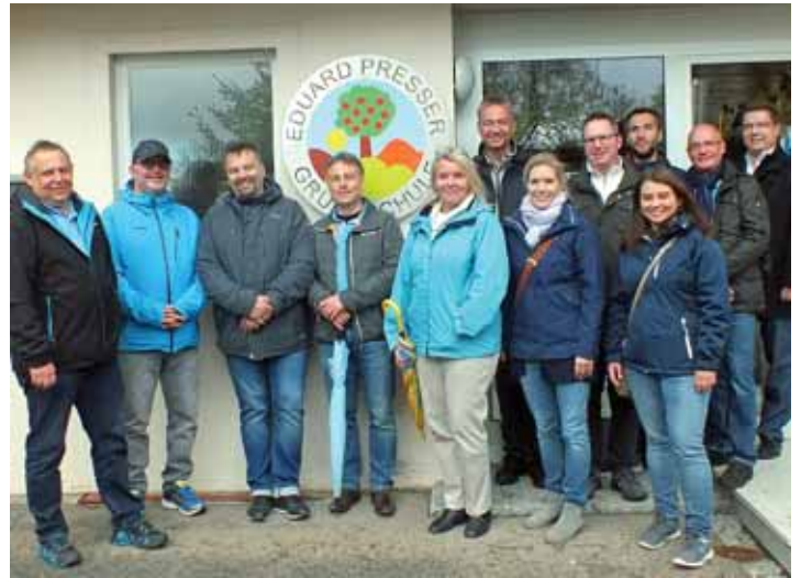
FDP-Gemeinderatskandidaten vor der Grundschule in Riedheim.

In Weiterdingen wurde der Kindergartenneubau angesprochen und der Wunsch geäußert, dass die katholische Kirche Betreiber des Kindergartens bleibt. Außerdem bestehe in Weiterdingen dringender Bedarf an Gewerbeflächen für ortsansässige Firmen. Die Kandidaten der FDP halten das für ein wichtiges Thema in der Gesamtgemeinde und sagten zu, sich für die Schaffung von Gewerbeflächen einzusetzen.