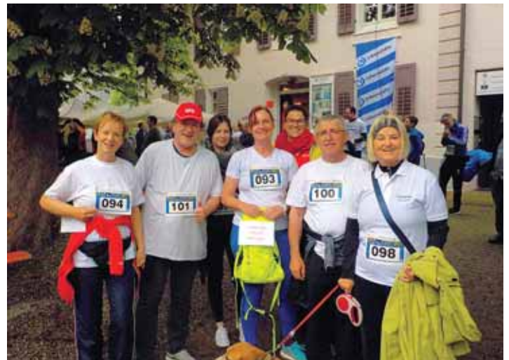
Die SPD/UL ist »sportlich« unterwegs und immer im Einsatz für die Mitbürger.

In der Mitte des Abfallkalenders finden Sie neben den Anmeldekarten für Elektronikschrott-Großgeräte, Kühlgeräte und Bildschirme zwei Karten zur Anmeldung Ihres Sperrmülls. Sie erhalten vom Müllabfuhr-Zweckverband Rielasingen-Worblingen schriftlich innerhalb von vier bis sechs Wochen den Abholtermin mitgeteilt. Weitere Informationen entnehmen Sie bitte dem Abfallkalender.