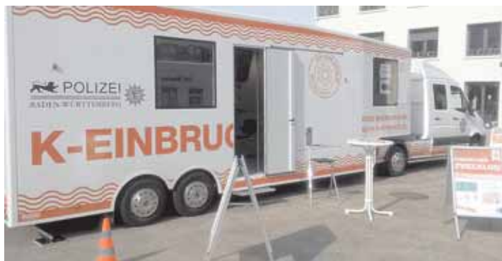
Die Polizei berät am Freitag, 24. Mai, von 10 bis 16 Uhr, im mobilen Informationsfahrzeug in der Fußgängerzone der August-Ruf-Straße in Singen.

Um Interessierte vor Einbrüchen, Betrugsstraftaten oder anderen Eigentumsdelikten zu schützen und vor finanziellen Schäden zu bewahren, informiert die Polizei am Freitag, 24. Mai, von 10 bis 16 Uhr, im mobilen Informationsfahrzeug in der Fußgängerzone der August-Ruf-Straße in Singen. Die Berater kommen auch gern nach vorheriger Vereinbarung, unter Tel. 07531/995-1044, nach Hause, um kostenfrei und neutral über Sicherheitstechnik zu informieren.